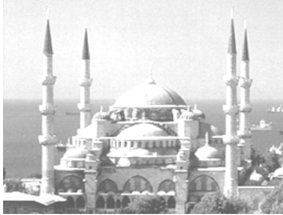
(Blaue Moschee in Istanbul)

Das Bild des Islam im Westen ist äußerst vielschichtig.